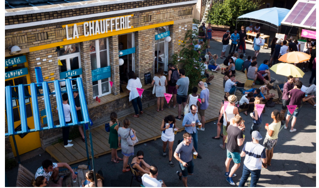
La Chaufferie des Grands Voisins