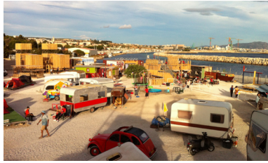
Fin de journée au camping