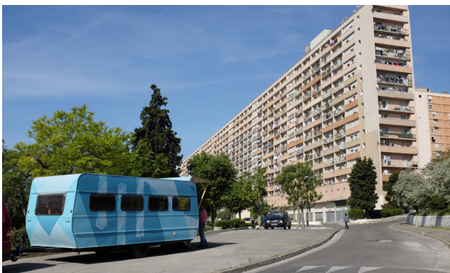
Caravane Atelier au jardin collectif de Campagne Lévêque