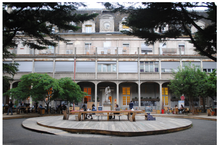
Cour Oratoire des Grands Voisins en juin 2018

Création de l'association Yes We Camp pour porter la réalisation collective d'une mini-ville éphémère, artistique et écologique, pour l'été de la Capitale européenne de la Culture. Au fil des mois de construction et de gestion du site, une équipe multiple se forme, qui deviendra le noyau du collectif Yes We Camp. Lorsqu'en novembre, nous remettons le terrain à son propriétaire le Port de Marseille, nous décidons de continuer l'aventure.