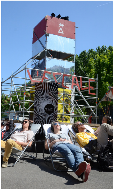
Sieste sonore à l'Escale, Pantin