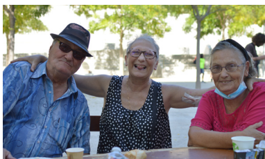
Repas à Cap Fada