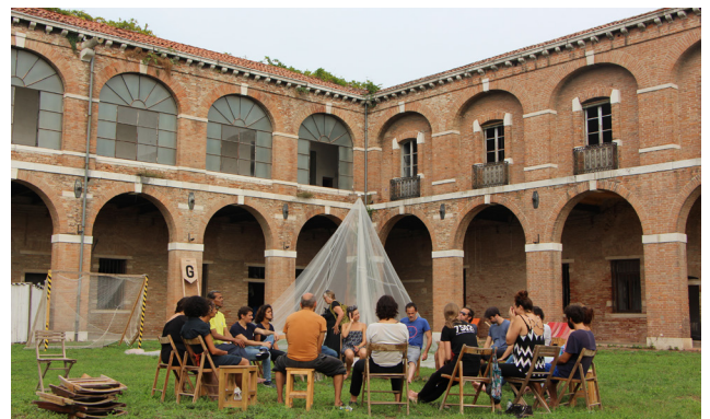
Esperienza Pepe, Biennale de Venise 2018