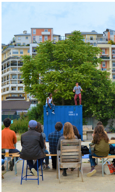
Théâtre à Vive Les Groues

Confirmation de notre capacité multi-sites