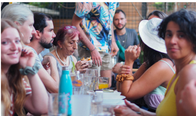
Velobabel à Coco Velten

Post Grands-Voisins nouveaux engagements