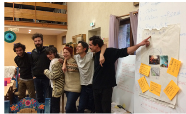
AG 2017 à l'îlot des Combes

Montée en puissance et évolutions internes